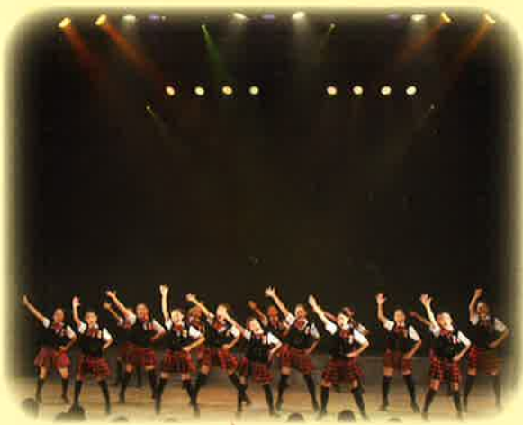
アマカホールを中心に、市民創作ミュージカルや市民企画によるコンサートなどを開催します。