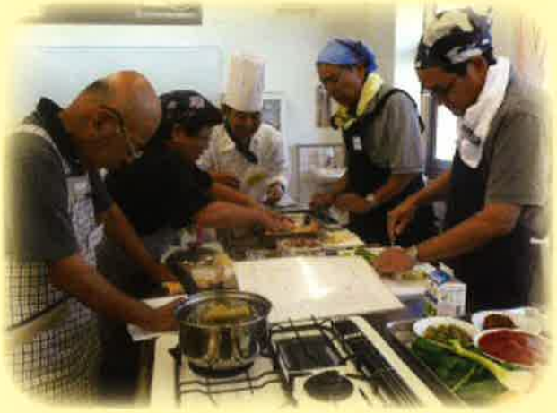
ロクハ荘、なごみの郷を中心に、多世代交流・介護予防に関する事業やロビーコンサートなどを開催します。